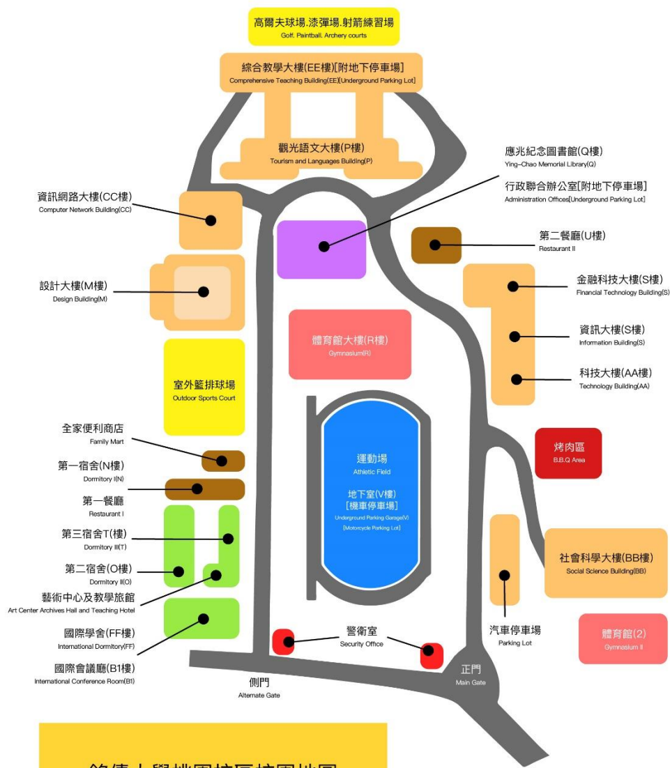
銘傳大學桃園校區校園地圖 Ming Chuan University Taoyuan Campus Map