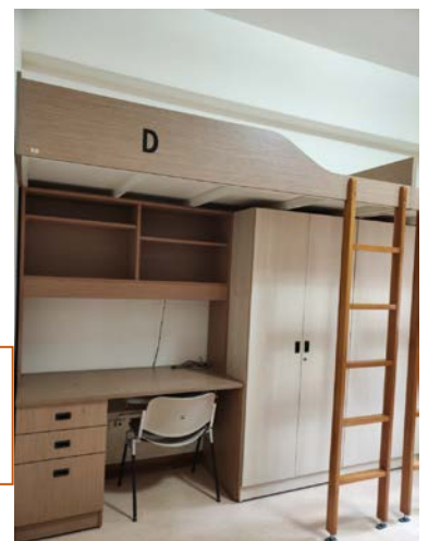
Taoyuan on-campus Dorm 桃園校內宿舍