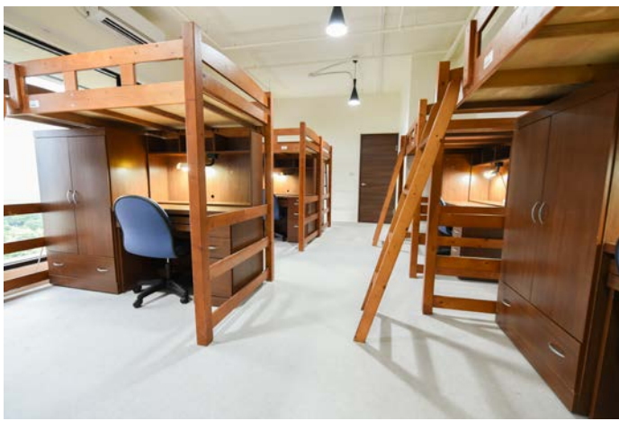
Taipei Off-campus Ji Xian Dorm 台北校外集賢宿舍

在左邊的欄位，"縣市"選03為桃園市，"地區"選49為龜山區；"租屋格局"選"套房"，而"套房租金(元/月)"通常介於NT$6,000~8,000，最後選取"搜尋"開始搜尋。