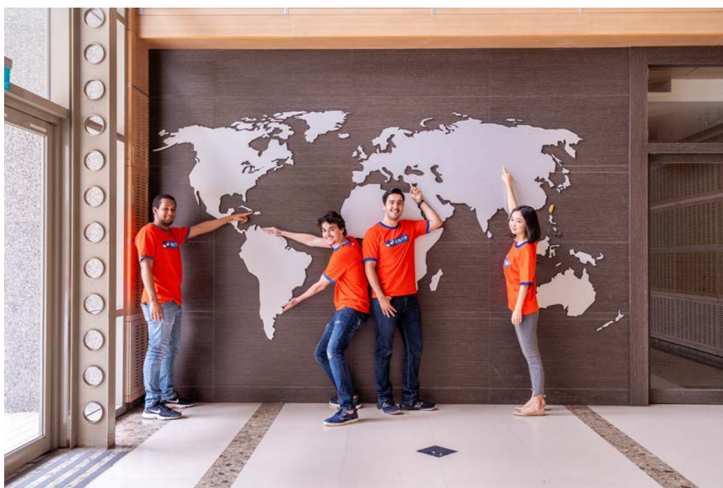
Taoyuan Campus 桃園校區