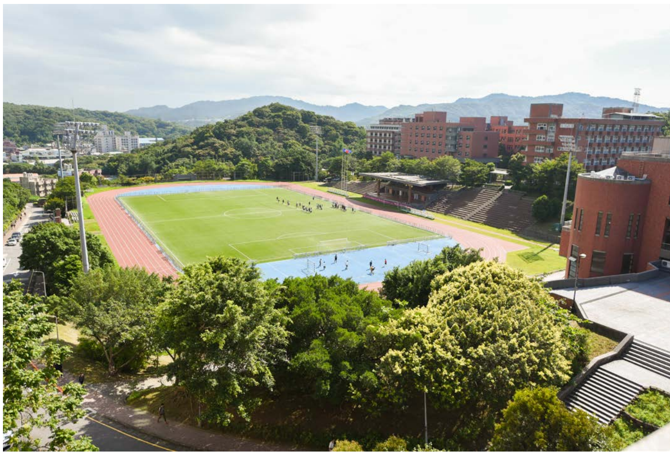
Taoyuan Campus 桃園校區