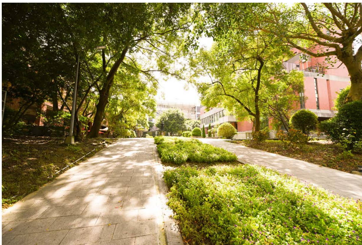
Taoyuan Campus 桃園校區