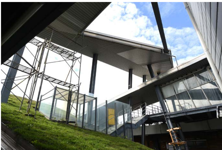
Design Building, Taoyuan Campus 桃園校區設計大樓

銘傳大學網站 https://gad.mcu.edu.tw/transportation/