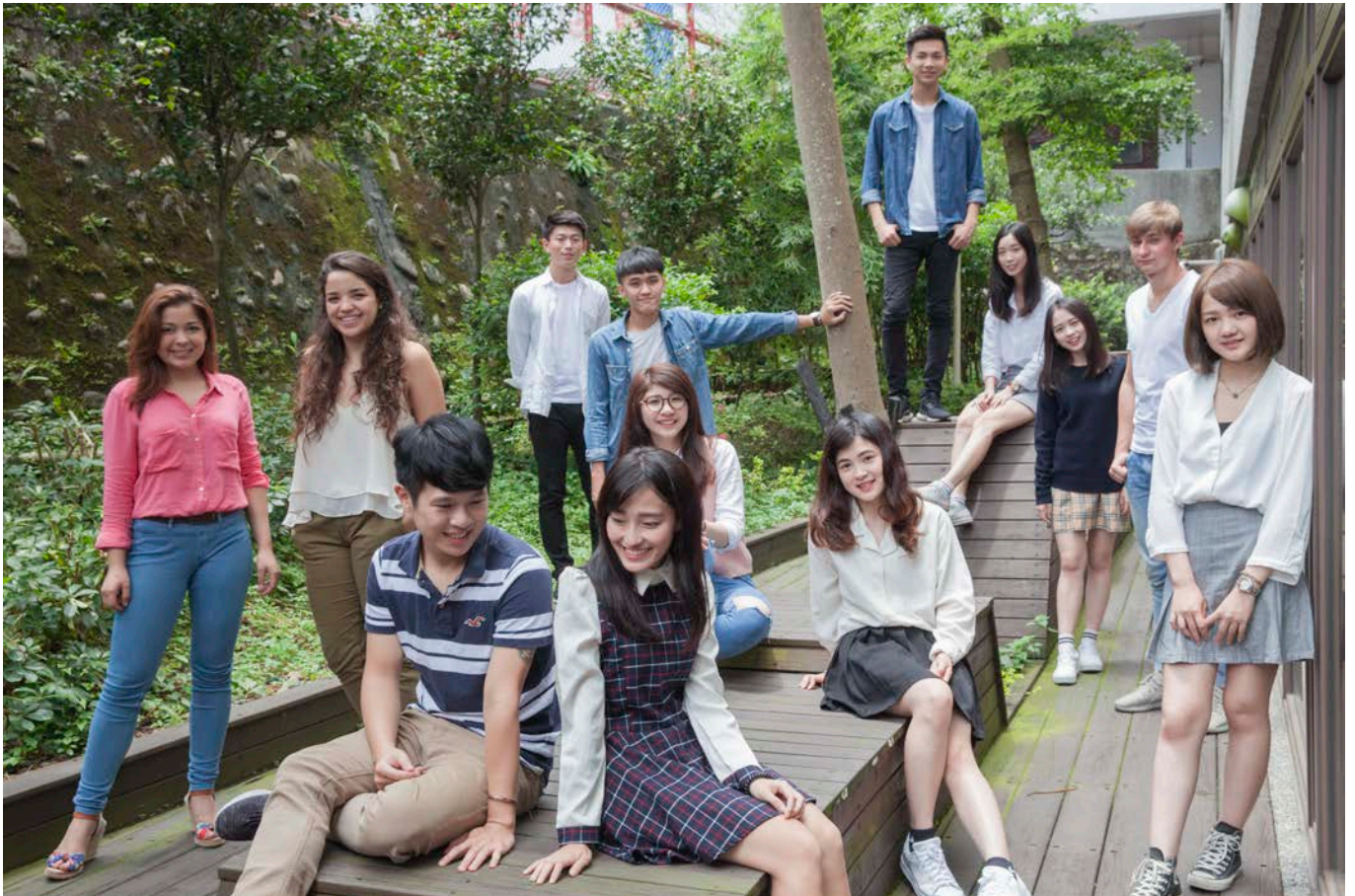
Taipei Campus 台北校區