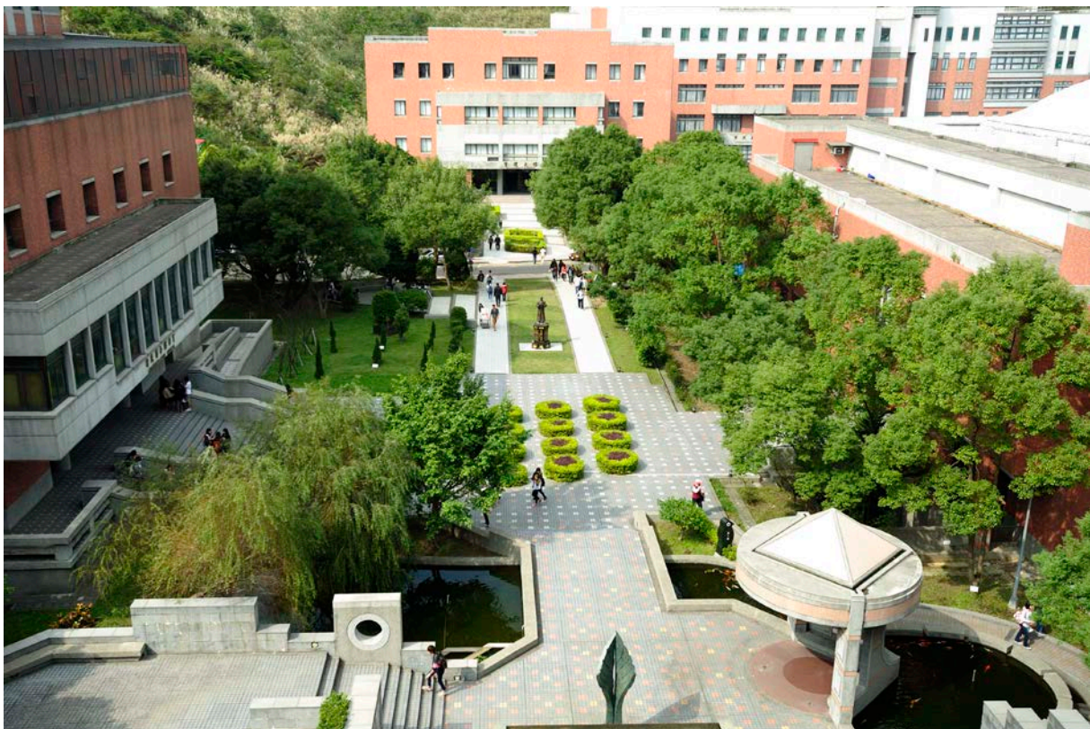
Taoyuan Campus 桃園校區

詳細系所資訊，請看教學單位 https://web2.mcu.edu.tw/teaching-unit/