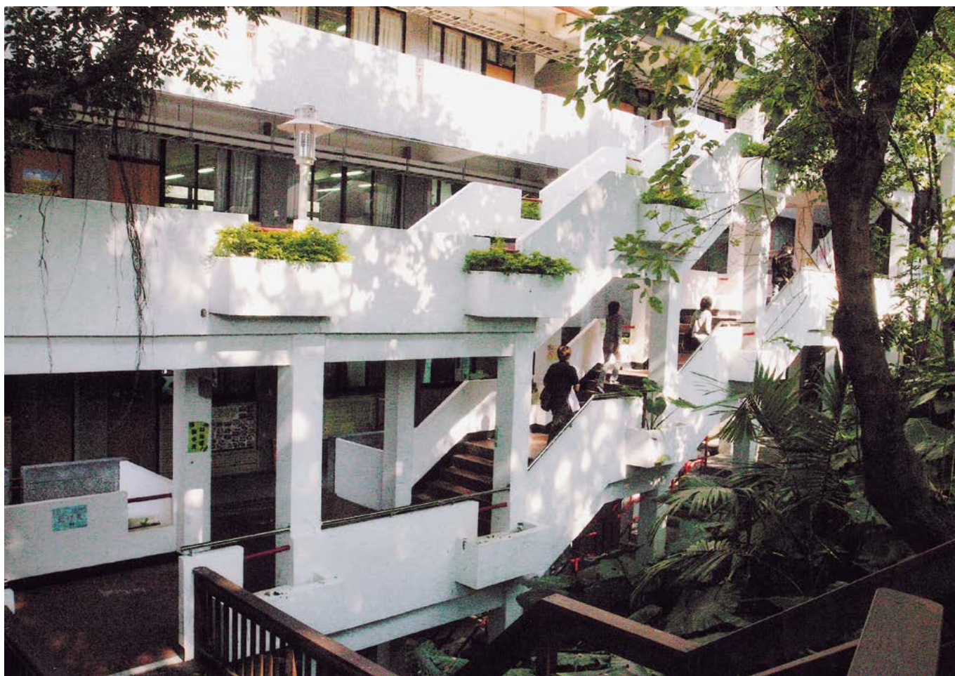
Taipei Campus 台北校區