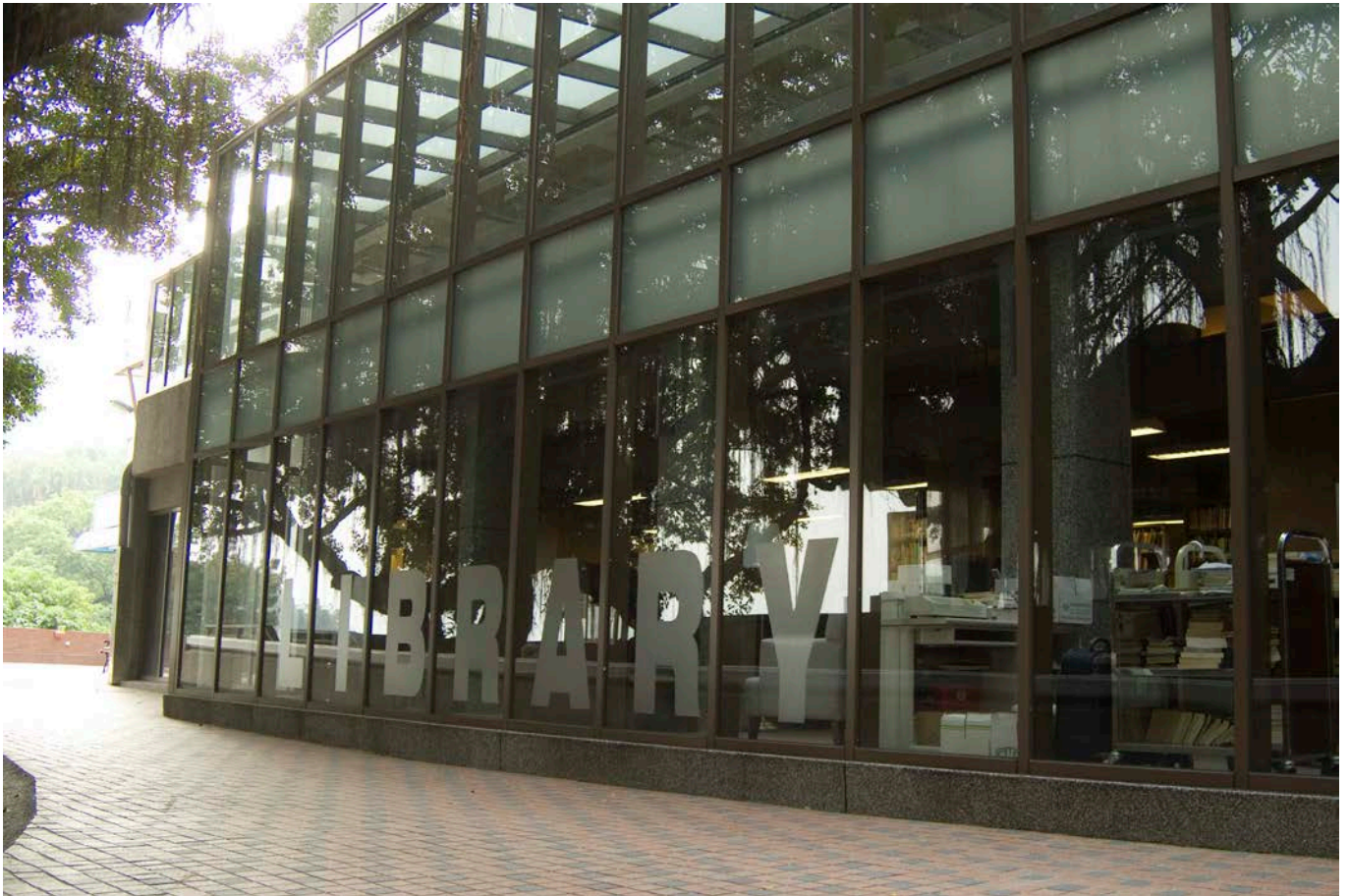
Taipei Campus 台北校區