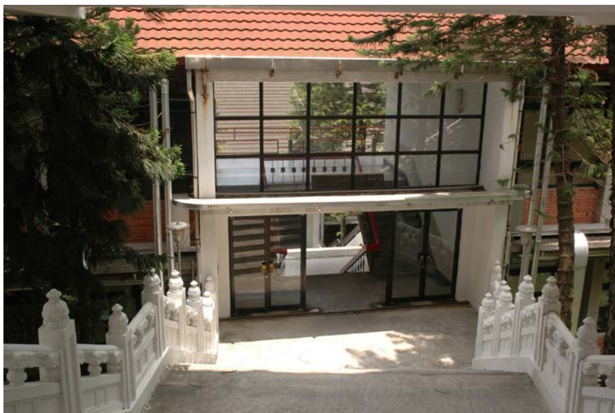
Taipei Campus 台北校區