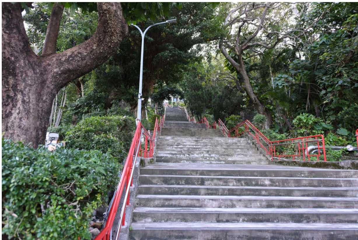
Taipei Campus 台北校區