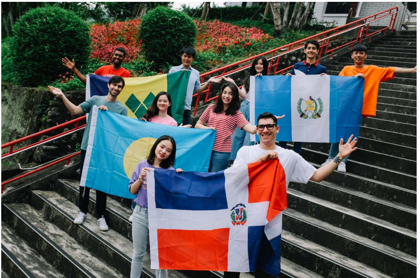
Taipei Campus 台北校區